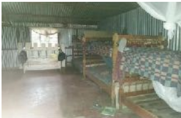
Schlafräume der Waisenkinder

Ein erster Erfolg ist der Bau und die Fertigstellung der neuen Versammlungshalle des Waisenhauses im März 2014.