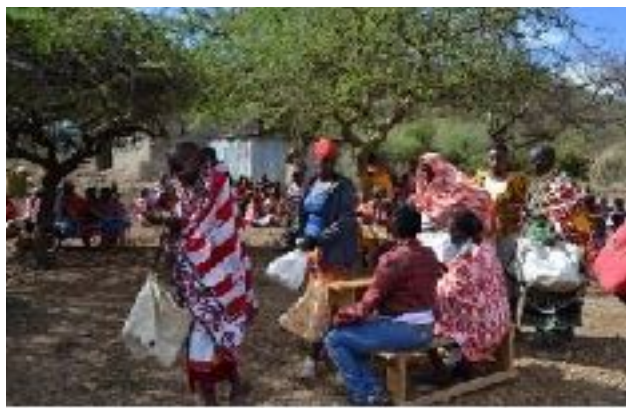
Armenspeisung der Masai 2013