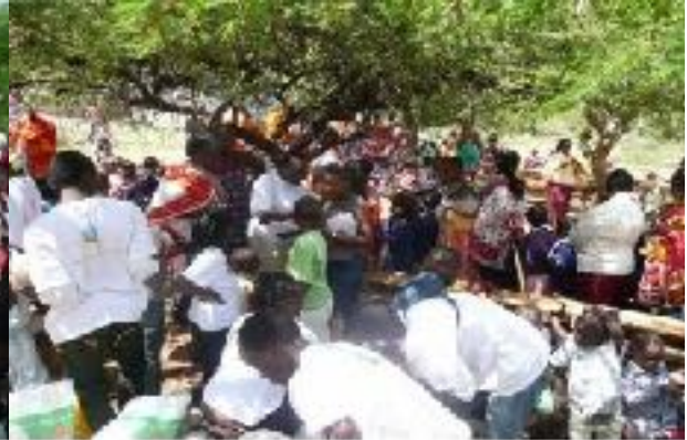
Armenspeisung der Masai 2012

Unsere Kooperation mit dem St. Paul's Children's Home in Ongata Rongai ist eine wunderbare Möglichkeit elternlosen Kindern aus armen Verhältnissen zu helfen. Während der Unterstützung des Waisenheims vor Ort hat sich unser Augenmerk jedoch auch immer wieder auf die arme Nachbarschaft des Heims gerichtet. Die Familien in der Nachbarschaft leiden ebenfalls unter großer Armut und großem Hunger. Die Eltern haben keine Arbeit und somit keine Möglichkeit ihre Familie zu ernähren. Sehr oft gibt es nur eine oder nicht einmal eine einfache Mahlzeit aus Maisbrei am Tag.