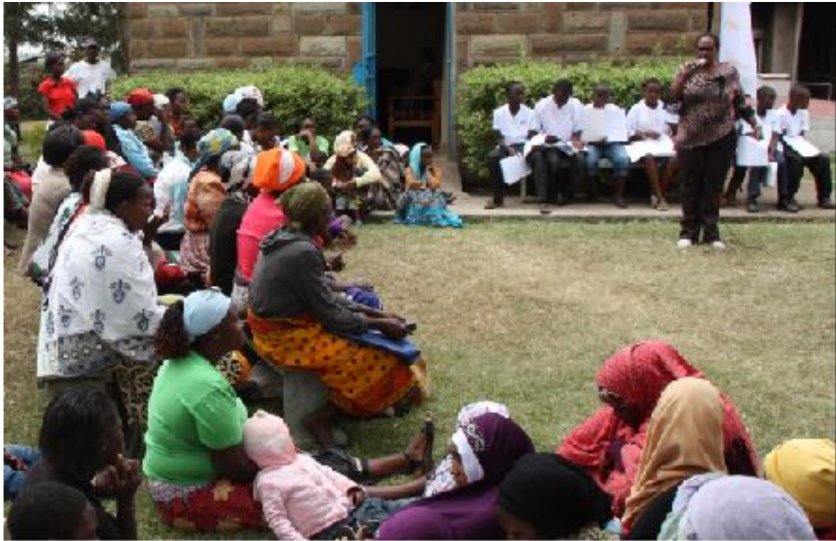
Armenspeisung der Nachbarschaft 2014