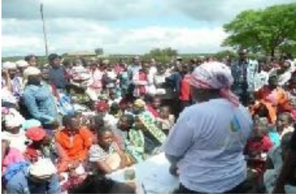
Armenspeisung der Nachbarschaft 2012