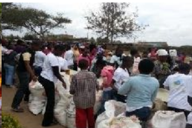
Armenspeisung der Nachbarschaft 2013