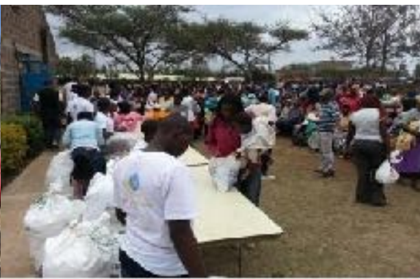
Armenspeisung der Nachbarschaft 2013