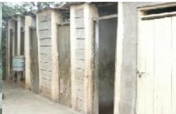
Sanitäranlagen im Waisenhaus