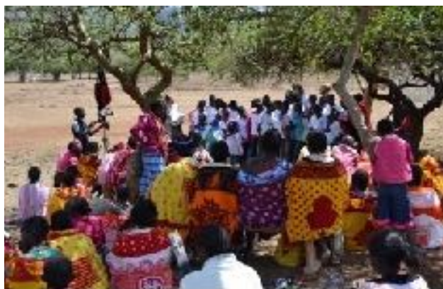
Armenspeisung der Masai 2013

Anfang Dezember 2013 wiederholten wir unsere Weihnachtsaktion mit dem selben Feedback wie im Vorjahr. Die Kinder und Mitarbeiter des St. Paul's Children's Home standen uns, wie auch im letzten Jahr, tatkräftig zur Seite. Auch die regionale Polizei unterstützte uns in der Absicherung des Geländes. Aufgrund der hohen, positiven Resonanz veranstalten wir diese Aktion mehrmals jedes Jahr.