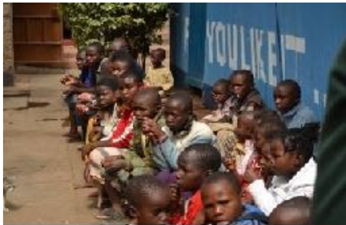
Die Kinder des St. Paul's Childrens Home

Mittlerweile leben dort rund 70 Waisenkinder und erhalten Unterkunft, Verpflegung und Ausbildung. Die Mittel des Heims sind allerdings sehr begrenzt, sodass wir es uns zur Aufgabe gemacht haben, das Waisenhaus in seinem Bestreben zu unterstützen den Kindern die Möglichkeit zu geben jetzt und in Zukunft ein menschenwürdiges Leben führen zu können. Nachdem wir die Bedingungen unter denen das St. Paul's Children's Home bisher seiner Arbeit mit Waisenkindern nachgehen musste grundsätzlich und nachhaltig verbessern konnten, besteht unsere Kooperation weiter, mit dem Ziel, das Heim mit neuen Gebäuden auszustatten, um ein sicheres Zuhause für künftig 100 Waisenkinder aus den Armenvierteln von Nairobi anbieten zu können.