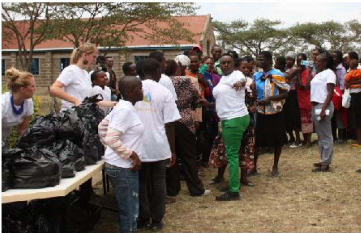
Armenspeisung der Nachbarschaft 2014